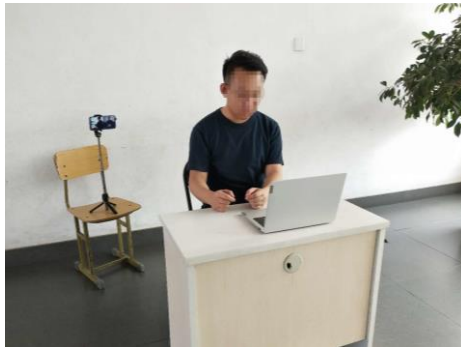
图1 考生“双机位”设备摆放布置示意图

要求“双机位”两台设备中至少有1台设备可移动，以便在开考前360°旋转查看四周环境和复试桌面。