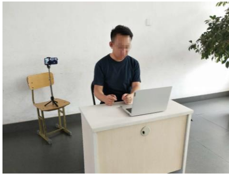
图1 考生“双机位”设备摆放布置示意图

要求“双机位”两台设备中至少有1台设备可移动，以便在开考前360°旋转查看四周环境和复试桌面。