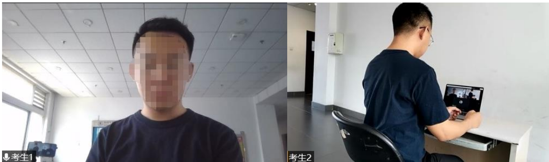
图2 “双机位”镜头显示的考生画面

4. 考生面试时正对摄像头保持坐姿端正，双手和头部完全呈现在复试专家可见画面中，不得佩戴口罩，保证面部清晰可见，头发不可遮挡耳朵，不得佩戴耳机和耳饰。