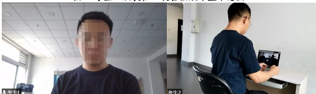
图2 “双机位”镜头显示的考生画面

4. 考生面试时正对摄像头保持坐姿端正，双手和头部完全呈现在复试专家可见画面中，不得佩戴口罩，保证面部清晰可见，头发不可遮挡耳朵，不得佩戴耳机和耳饰。