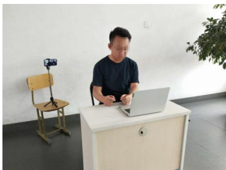
图1 考生“双机位”设备摆放布置示意图

要求“双机位”两台设备中至少有1台设备可移动，以便在开考前360°旋转查看四周环境和复试桌面。