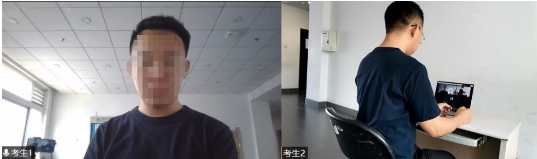
图 2 “双机位”镜头显示的考生画面

4. 考生面试时正对摄像头保持坐姿端正，双手和头部完全呈现在面试专家可见画面中，不得佩戴口罩，保证面部清晰可见，头发不可遮挡耳朵，不得佩戴耳机和耳饰。