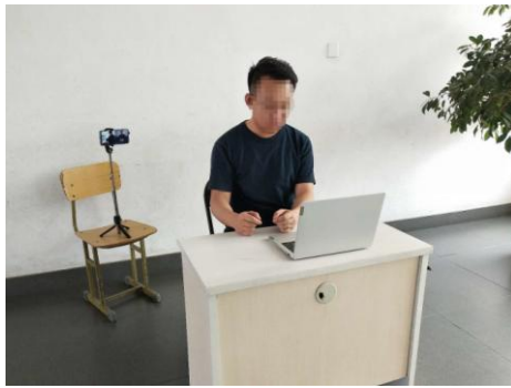
图 1 考生“双机位”设备摆放布置示意图