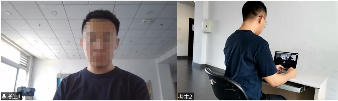
图2 “双机位”镜头显示的考生画面

4. 考生面试时正对摄像头保持坐姿端正，双手和头部完全呈现在复试专家可见画面中，不得佩戴口罩，保证面部清晰可见，头发不可遮挡耳朵，不得佩戴耳机和耳饰。