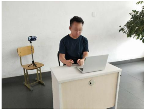
图1 考生“双机位”设备摆放布置示意图